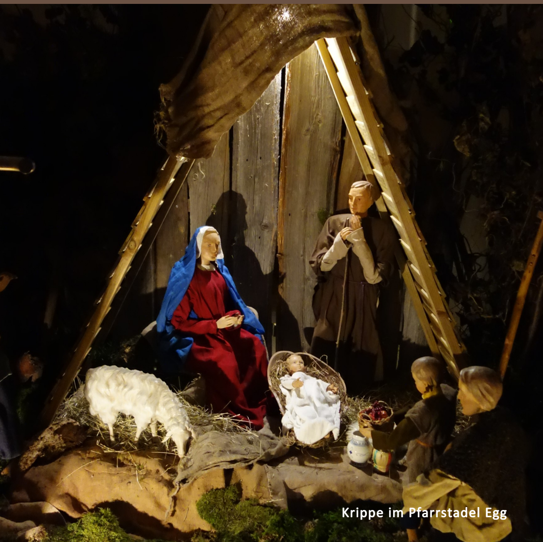
Krippe im Pfarrstadel Egg

Pfarrgemeinde St. Bartholomäus Egg a.d. Günz Advent und Weihnachten 2023